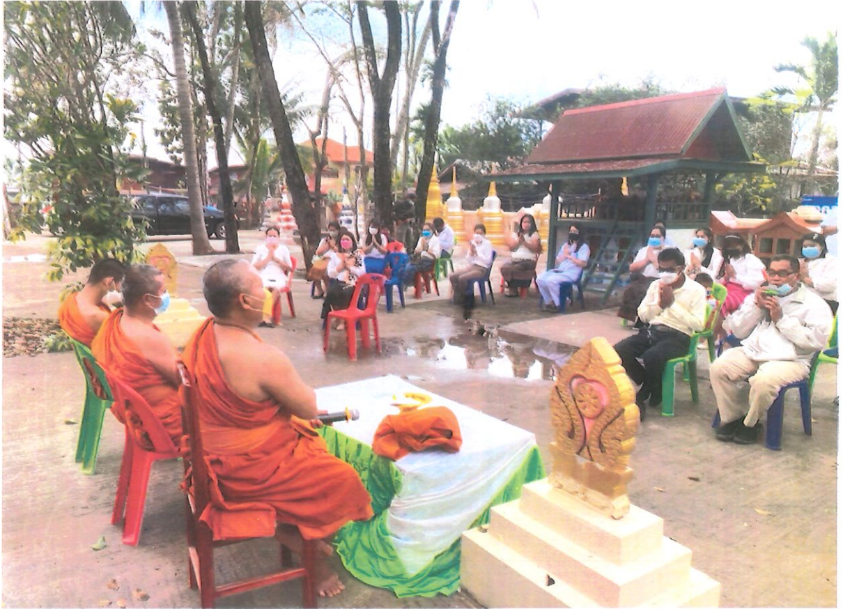
กิจกรรมฟังธรรม ณ วัดสร้อยพร้าว บ้านวาน ตำบลบ้านวาน อำเภอท่าบ่อ จังหวัดหนองคาย