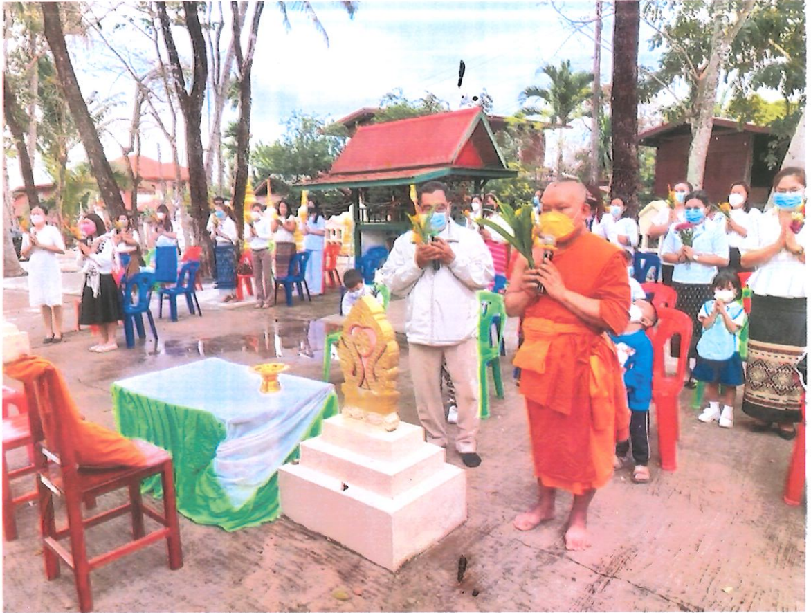
กิจกรรมเวียนเทียนรอบอุโบสถ ณ วัดสร้อยพร้าว ตำบลบ้านवान อำเภอท่าบ่อ จังหวัดหนองคาย