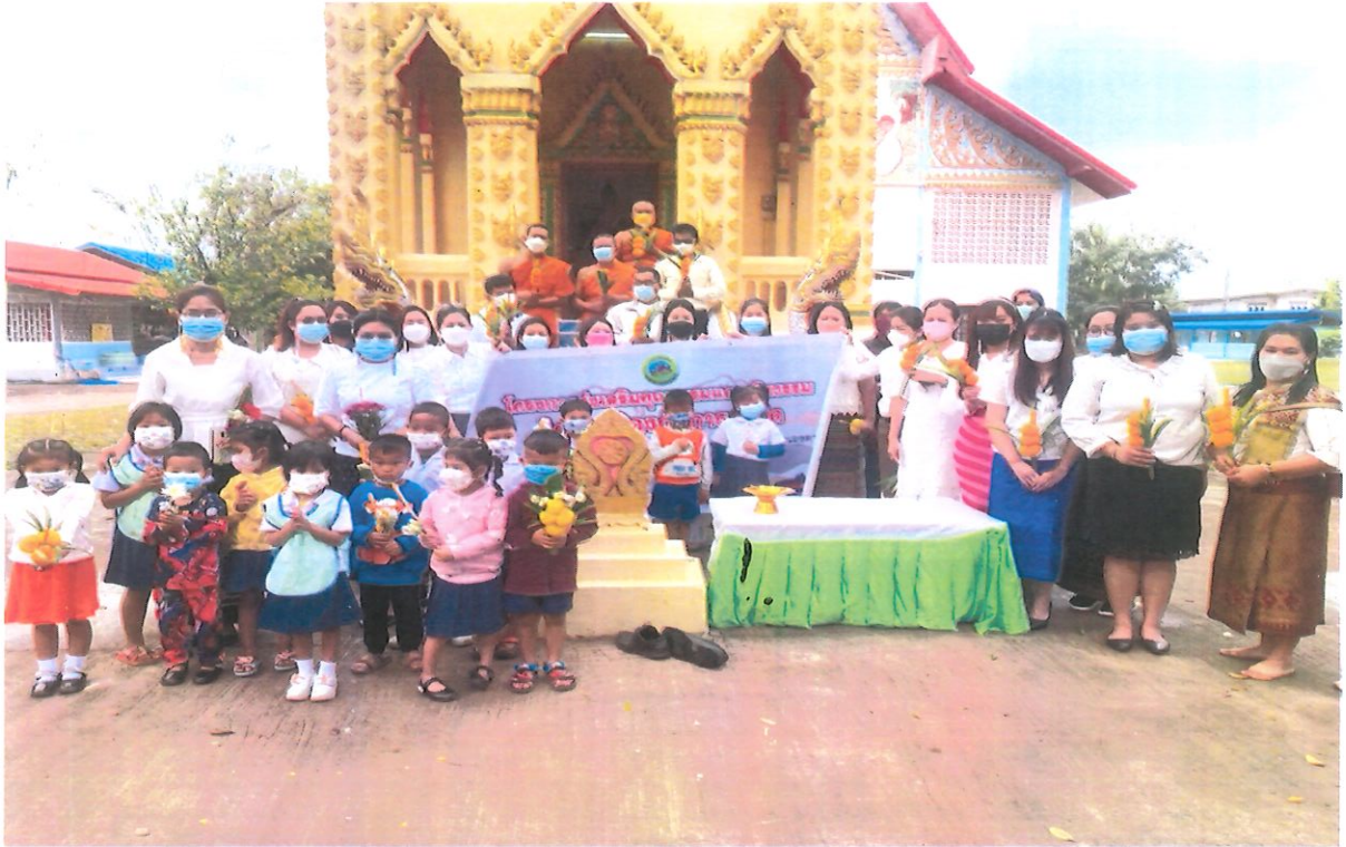
โครงการส่งเสริมคุณธรรมจริยธรรมฯ ณ วัดสร้อยพร้าวบ้านวาน หมู่ ๑