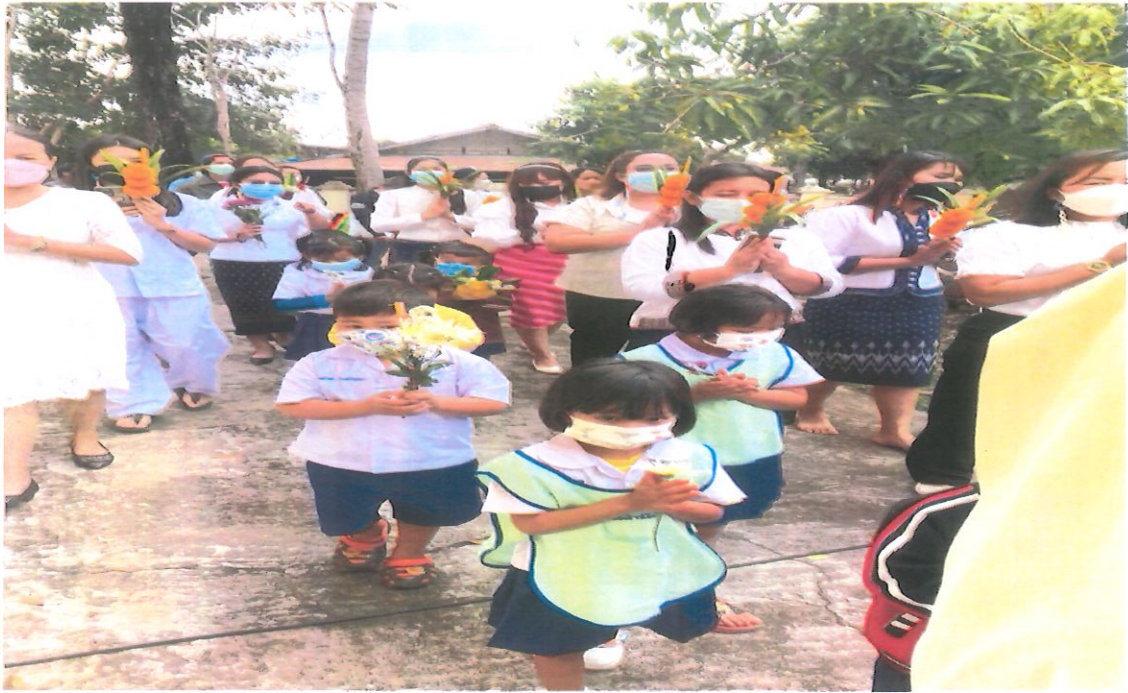
กิจกรรมเวียนเทียนรอบอุโบสถ ณ วัดสร้อยพราว ตำบลบ้านว่าน อำเภอท่าบ่อ จังหวัดหนองคาย !