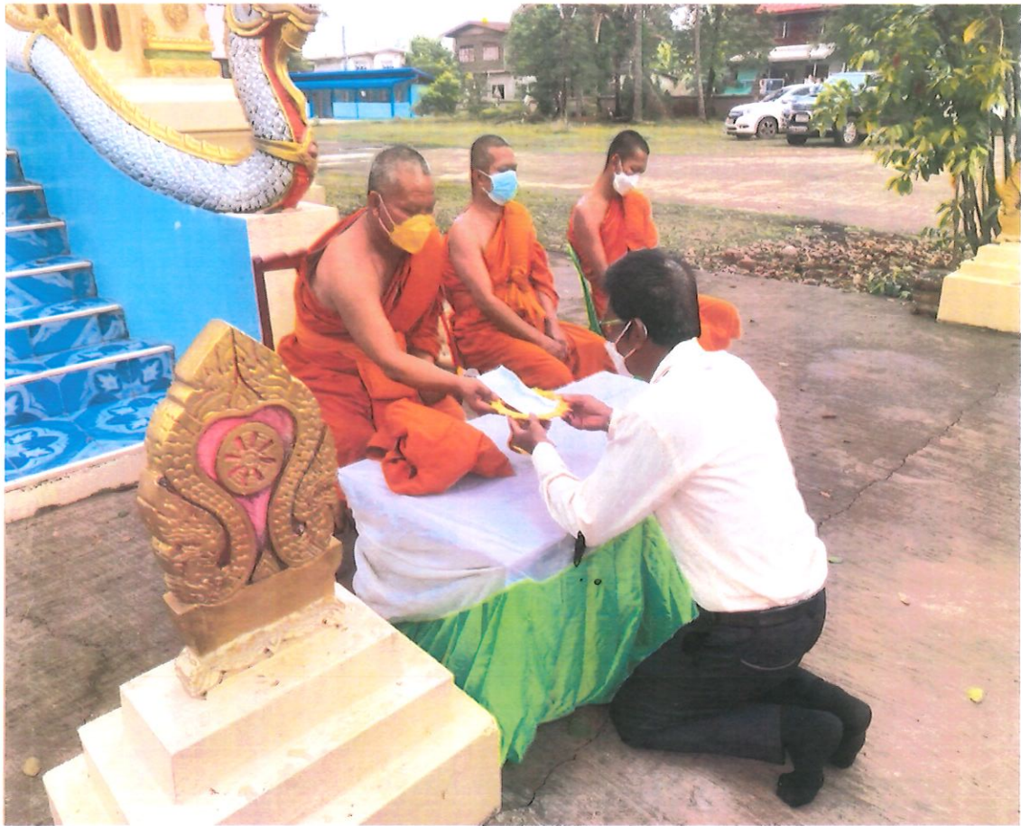
กิจกรรมถวายจตุปัจจัยให้แก่เจ้าอาวาสวัดสร้อยพร้าว บ้านว่าน ตำบลบ้านว่าน อำเภอกำแพงแสน จังหวัดนครปฐม